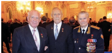
День Героев Отечества в Кремле