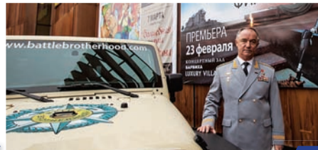
Международный Марш Ветеранов