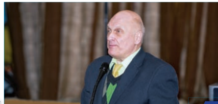
Уроки Великой Отечественной