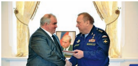
Вахта Героев Отечества